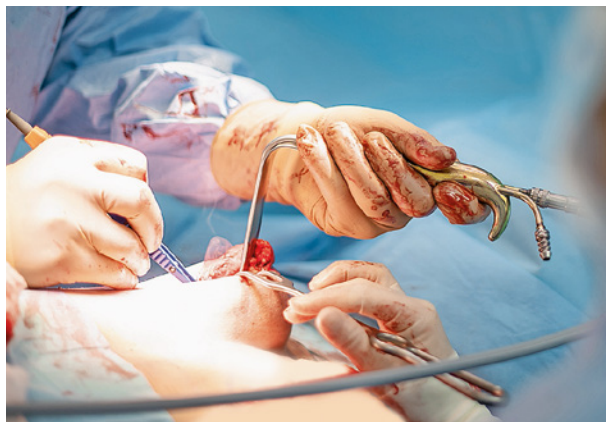
↑ Operácia trvala takmer tri hodiny.